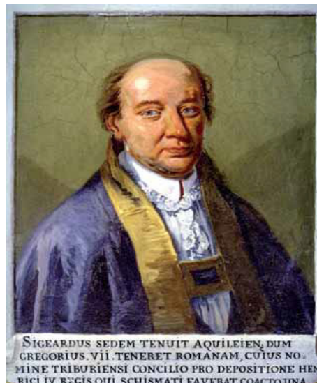
Sigart, patriarcje di Aquilee