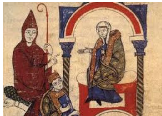
Ricostruzione del castello di Matilde di Canossa Matilde, il papa Gregorio VII e Enrico IV

A questo punto sono i principi tedeschi a deporre Enrico IV, nominando al suo posto il cognato Rodolfo.