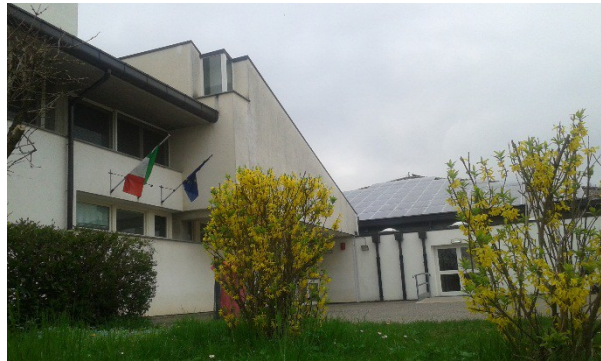
La jentrade de Scuele secundarie di I grât Pelegrin di Sant Denel